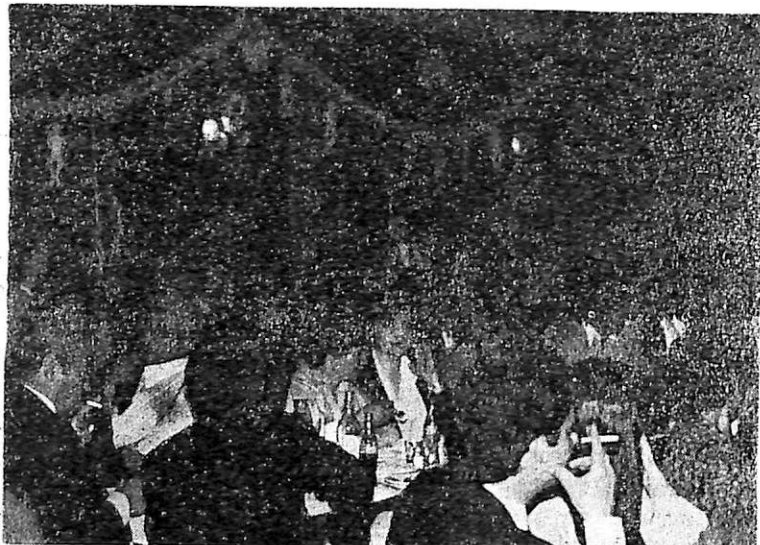
Μερική άποψη του Αποκριάτικου χορού μας.