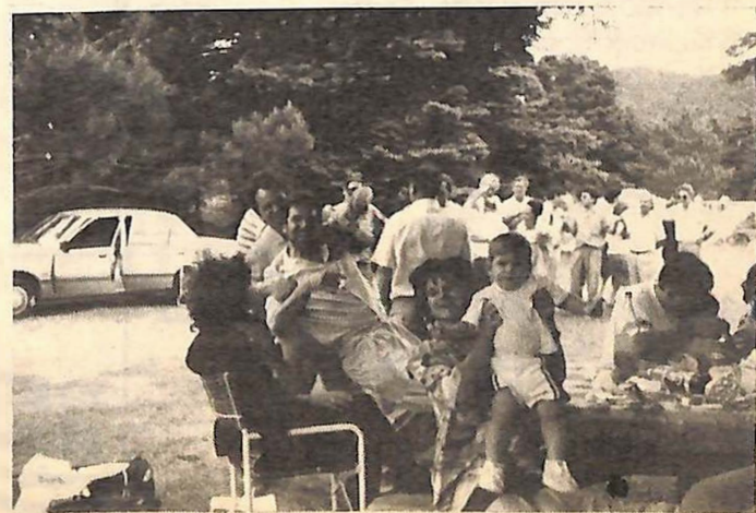
Στιγμιότυπα από την Εκδρομή στην Πάρνηθα