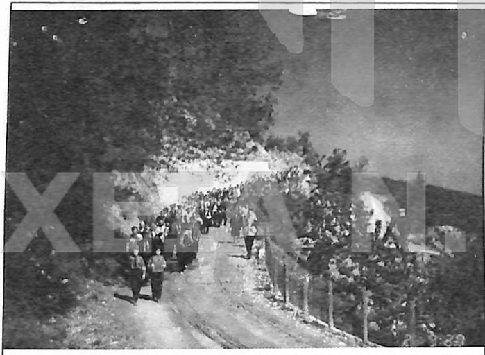
Τα Σίγνα στις Σκάλες