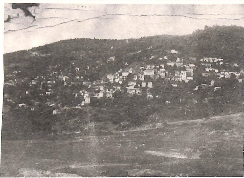
Μορφοβούνι 1962-65

Βαλτετσίου 17 Καρδίτσα - 43.100 τηλ: 1/29773