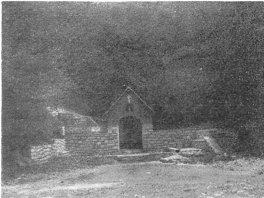
Τό «Αγίασμα» μετά την αποπεράτωσή του.

Τό πώς παρουσιάζεται σήμερα ο χώρος αυτός δεν θά επιχειρήσουμε να σας περιγράψουμε. Φτάνει να περάσετε τώρα από εκεί για να δείτε με τὰ μάτια σας. Νομίζουμε ότι τέτοια έργα αξίζει να γίνονται, γιατί, σ' αλήθεια, αξιοποιούν και όμορφαίνουν το χωριό μας.