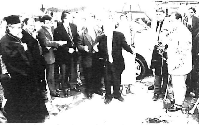
Στημιότυπο από τη φύτευση πλάτανου από τον Αντώνη Σαμαράκη, μετά την τελετή απονομής των βραβείων του Α Διαγωνισμού, Κυριακή 13/5/2001 (Ο πλάτανος βέβαια ριζωσε, ο Διαγωνισμός ωστόσο μαράθηκε...)

Τρίτη φορά ο Αντώνης ήλθε στις 12/5/2001, για την απονομή των βραβείων του «Α Λογοτεχνικού Διαγωνισμού Αντώνης Σαμαράκης». Σε εκείνη την ιστορική εκδήλωση, φύτεψε στην πλατεία έναν πλάτανο (η ιδέα ήταν του Θ. Νικολάου) με την ευχή «να ριζώσει ο Διαγωνισμός και να ψηλώνει σαν τον πλάτανο».