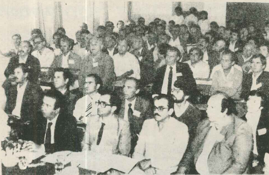
Αντιπρόσωποι των Αγραφιωτικών χωριών στο Α' Συνέδριο.

Καρδίτσας υπηρεσίες του Υπουργείου Πολιτισμού και Έπιστημών, Ε.Ο.Τ. και ΕΟΜΕΧ.