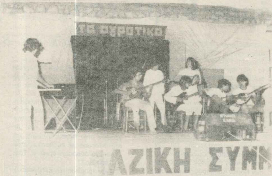
Η κομπανία Δήμου Συκιές Θεσσαλονίκης από τη συμμετοχή στις εκδηλώσεις «ΑΓΡΟΤΙΚΑ».

Η θεατρική παράσταση από το Σύλλογο Αγ. Γεωργίου, τό πλούσιο λαϊκό πρόγραμμα από «μικρή κομπανία» παιδιών του χωριού και ο αγώνας δρόμου από τό Διάσελο