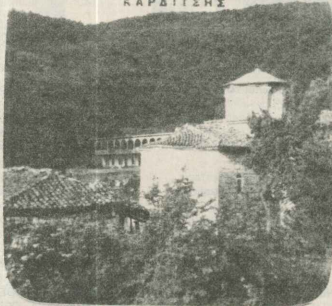
Ι. Μ. ΠΕΤΡΑΣ ΚΑΤΑΦΥΓΙΟΥ ΚΑΡΔΙΤΣΗΣ

ἐπανιδρύθηκε κατὰ τὴ δεκαετία 1920 - 1930 με διάταγμα, ὕστερα ἀπὸ πρωτοβουλία τοῦ τότε Μητροπολίτη Ἰεζεκιήλ. 35 ὀλόκληρα χρόνια διακονοῦσε τὸ μοναστήρι ὁ ἐρημίτης ἱερομόναχος Λεόντιος μέχρι τὴν ἡμέρα πού ἀπὸ πυρκαγιά πού προκλήθηκε στό κελί του βρήκε τραγικό θάνατο (28 Νοεμβρίου 1981).