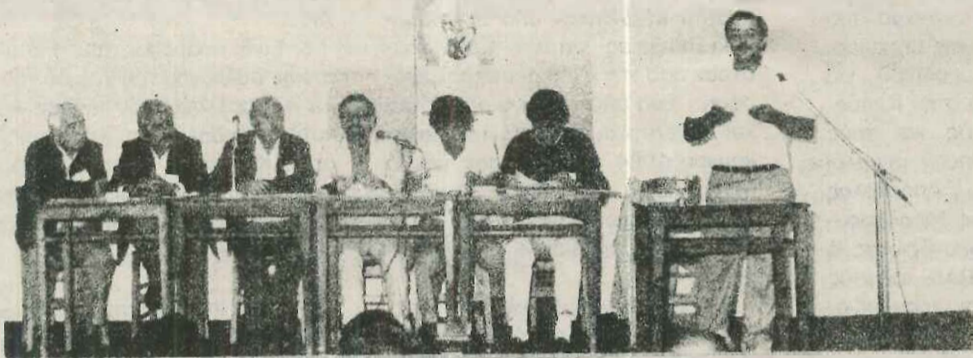
Η έπταμελής προσωρινή επιτροπή που όργωνσε το ΣΥΝΕΔΡΙΟ.

Α' ΣΥΝΕΔΡΙΟ ΑΓΡΑΦΙΩΤΙΚΩΝ ΧΩΡΙΩΝ ΑΜΑΡΑΝΤΟΣ 18 ΚΑΙ 19 ΑΥΓΟΥΣΤΟΥ