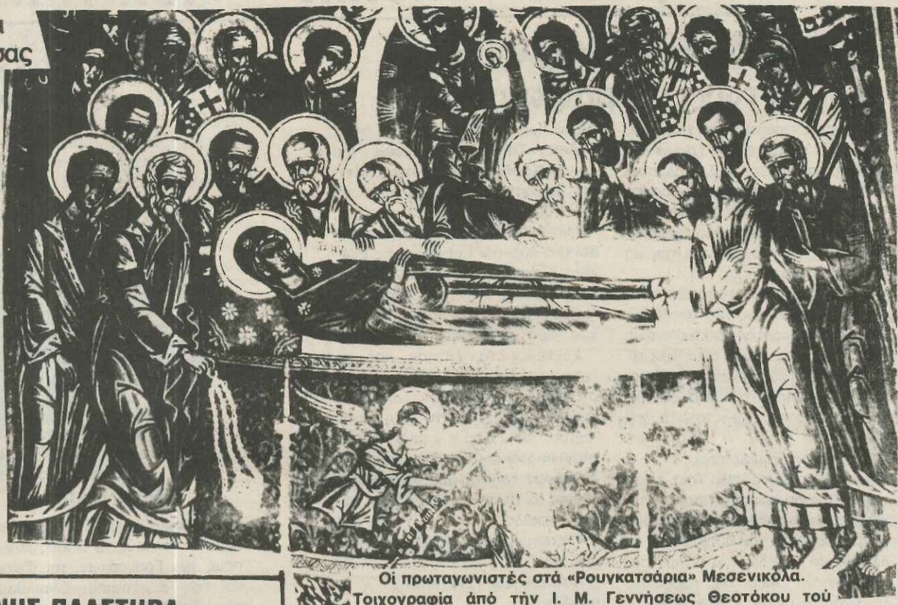
Οι πρωταγωνιστές στα «Ρουγκατσάρια» Μεσσηνικόλα. Τοιχογραφία από την Ι. Μ. Γεννήσεως Θεοτόκου του Αθηρού.

Στά 200 αυτά χρόνια, η καλλιτεχνική παραγωγή συνεχίζεται χωρίς διακοπή από έναν ή περισσότερους