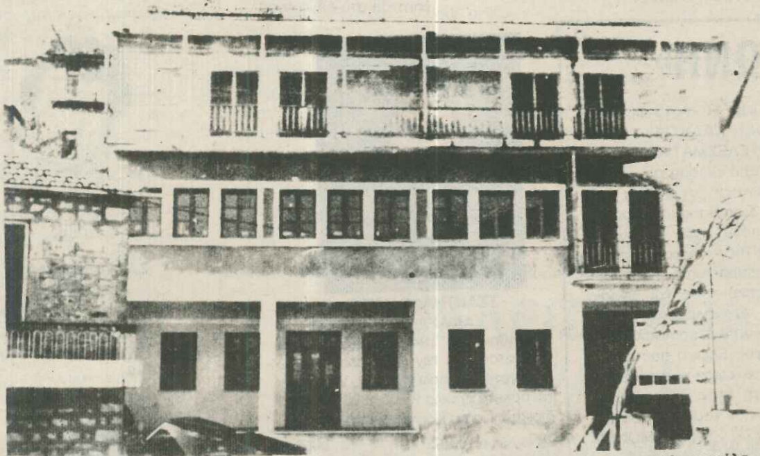
Τό εξαιρετικής όμορφιάς Πνευματικό Κέντρο Μεσενικόλα.