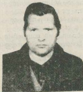
ΔΗΜΟΣ ΚΩΝ/ΝΟΣ ΚΡΥΟΝΕΡΙ

ΣΗΜ: Στο επόμενο φύλλο θα συνεχιστεί η παρουσίαση των κοινοταρχών.