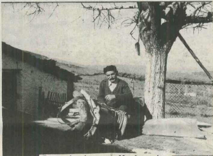
Γραφικός τύπος του Μπελοκομίτη