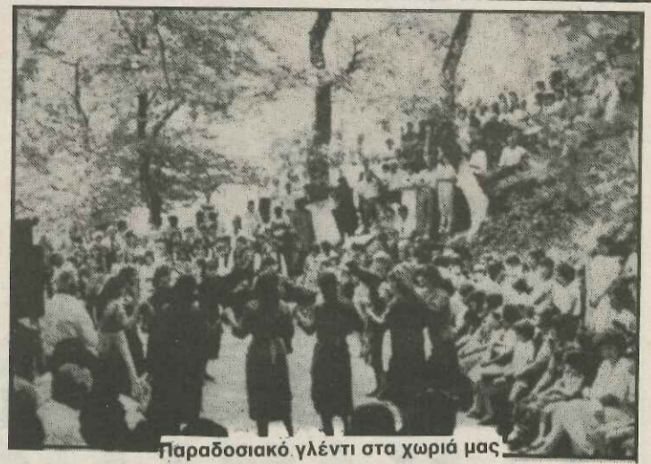
Παραδοσιακό γλέντι στα χωριά μας.

★ Από τις αρχαιρεσίες του Μορφωτικού Συλλόγου Βαθυλάκκου στις 21 Φλεβάρη, ε-