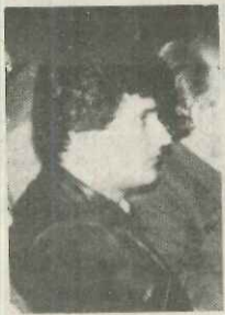
ΜΙΑ ΕΛΕΥΘΕΡΗ ΣΤΗΛΗ ΤΟΥ ΒΑΣΙΛΗ ΤΣΑΝΤΗΛΑ