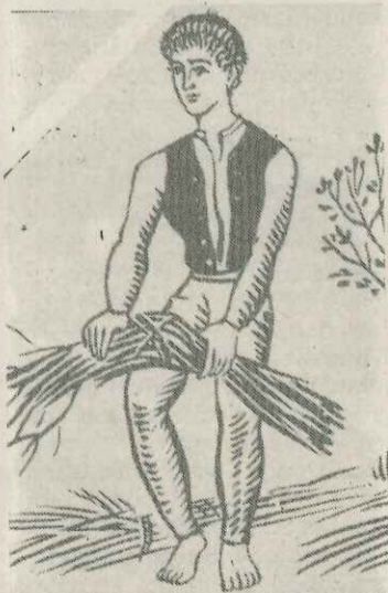
«Εν τη ενώσει η ισχύς»

Καρδιτσιώτες της συμπρωτεύουσας περάστε το Μάρτη από τη ΔΕΘ.