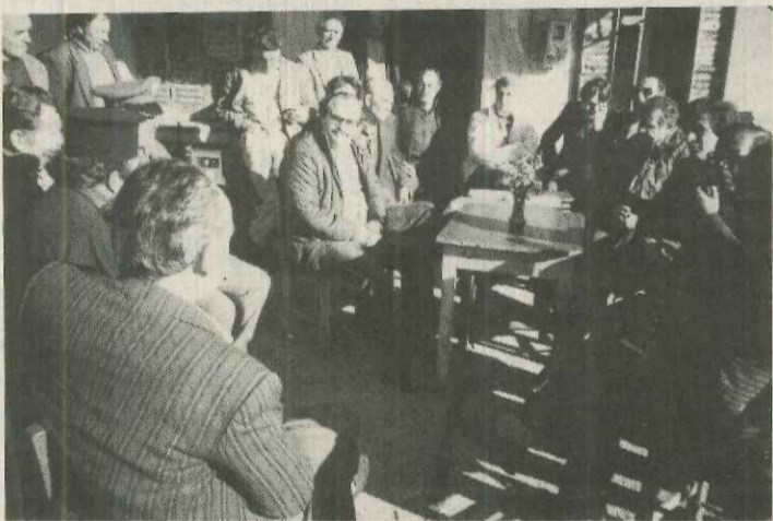
Στιγμιότυπο από τη Λαϊκή Συνέλευση στο Κρουονέρι. Τα προβλήματα του χωριού επι τάπητος.....

Απαιτείται πίστωση 2 εκατ. Συνηγορούμε θερμά στο δικαιο αίτημα γιατί οι γεωργικές καλλιέργειες στα ορεινά γίνονται με πολύ ιδρώτα.