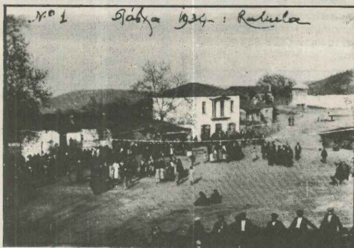
«Πάσχα του 1934 στη Ραχούλα»

Καλαίσθητο ημερολόγιο εξέδωσε και φέτος ο Σύλλογος, σε συνεργασία με την Ένωση Ραχουλιωτών Αθήνας. Το ημερολόγιο κοσμεί σπάνια φωτογραφία, που βρέθηκε στο αρχείο του αείμνηστου καθηγητή Χρήστου Παπαλεωνίδα.