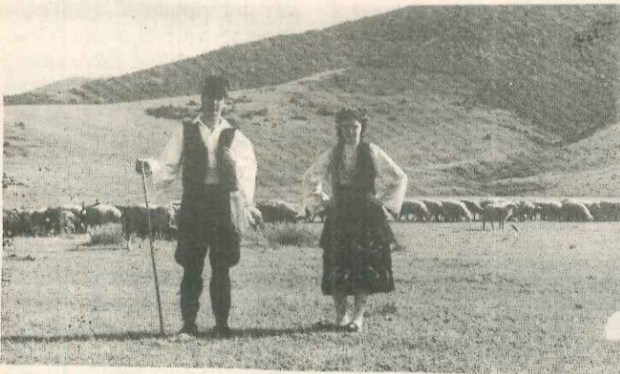
Στο ρυθμό άσματος της εποχής, από άλλες καλές και ξενοιαστές ποιμενικές στιγμές.

Η πιο ΑΝΘΡΩΠΙΝΗ ΟΔΙΚΗ ΒΟΗΘΕΙΑ δεν ήταν δυνατό να μην αντιμετωπίσει και αυτό το πρόβλημα των συνδρομητών της.