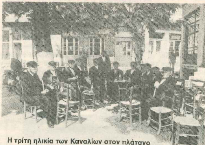
Η τρίτη ηλικία των Καναλιών στον πλάτανο