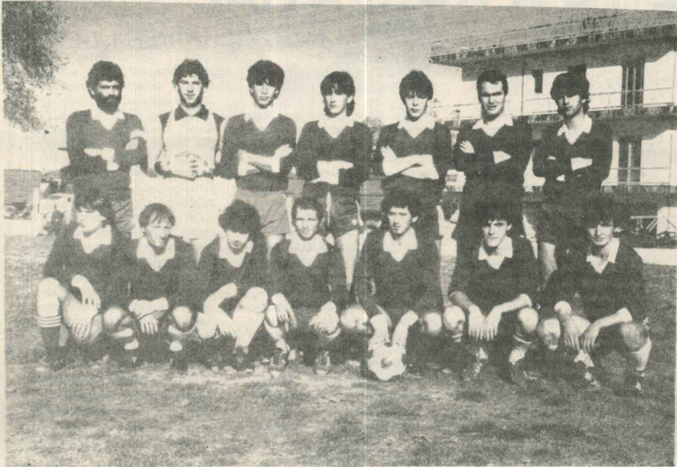
Η ποδοσφαιρική ομάδα της Σέκλιζας.

Γράψαμε σ' άλλο φύλλο της εφημερίδας μας, ότι ο αθλητισμός στην περιοχή Αγράφων δε μπορεί να καλλιεργηθεί λόγω έλλειψης χώρων ή και νέων ανθρώπων ακόμη.