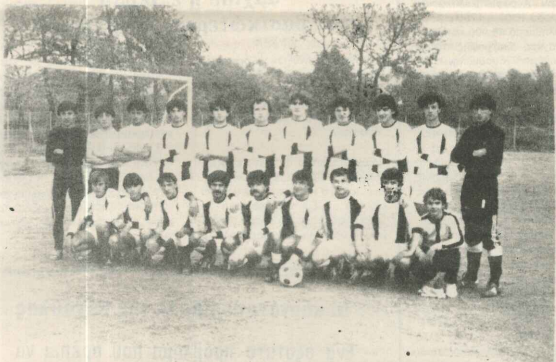
Η ποδοσφαιρική ομάδα της Απιδιάς.

Ας είναι ελαφρύ το χώμα που τον σκεπάζει.