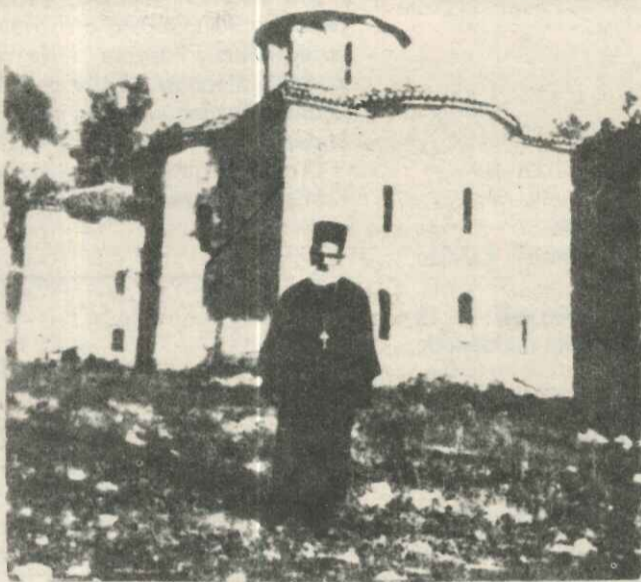
Ο ιερομόναχος Λεόντιος που κάηκε τό 1982.

Η αναφορά της ύπευθύνου αρχαιολόγου καταλήγει με την γνωστή έπωδό, που χαρακτηρίζει άσφαλώς τό ψυχικό δράμα των Έλλήνων αρχαιολόγων αλλά και τό «δράμα» του Ελληνικού Κράτους: «Αί έργασια διεκόπησαν λόγω έξαντλήσεως της σχετικής πιστώσεως!». Έτσι, από τότε τό μνημείο περιμένει, ζωμένο σέ σκαλωσιές, ενώ τά ρήγματά του άνοίγουν περισσότερο, οι ύγρασίες κατατρώγουν τις ενδιαφέρουσες τοιχογραφίες και μερικοί στο χωριό μιλούν για κατεδάφιση με σκοπό να άνεγερθεί νέος ναός στην ίδια θέση!