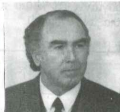
Γράφει ο Λάμπρος Γριβέλλας

- ΑΠΟΣΤΕΛΛΕΤΑΙ ΚΑΙ ΜΕ ΑΝΤΙΚΑΤΑΒΟΛΗ ΑΠΟ ΤΑ ΓΡΑΦΕΙΑ ΜΑΣ (ΤΗΛ. (0441) 29642)