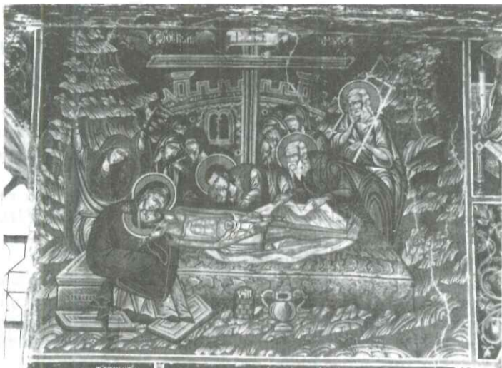
Αποκαθήλωση: Αγ. Γεώργιος Ρεντίνας

Η προστασία ενός μνημείου από την Εφορεία μας απαιτεί σταθερή και σταδιακή πολιτική θα λέγαμε τόσο λόγω της υφιστάμενης κατάστασης όσο και της ιδιόρρυθμης αντιμετώπισης που αυτό απαιτεί. Οι εχθροί που καλούμεθα να αντιμετωπίσουμε είναι τόσο οι δύσκολες καιρικές συνθήκες που επιφέρουν και τις μεγαλύτερες φθορές στο μνημείο όσο και η άγνοια ή υπερπροστασία μερικές φορές των ανθρώπων που ζούν γύρω από αυτό. Και να τα προβλήματα είναι τεράστια και αν απαιτούν άμεση λύση ο χρόνος δεν είναι τόσο απλόχερος μαζί μας. Μας διαθέτει μόνο λίγους μήνες αυτού του θέρους για ν' αποκαταστήσουμε πολυκαιρές φθορές που προκαλούν οι άνεμοι, η υγρασία, ο παγετός, οι χαμηλές θερμοκρασίες που μπορεί για τους Αγραφιώτες να είναι μια καθημερινή ρουτίνα για τα μνημεία όμως είναι η κύρια πηγή των κακών του.