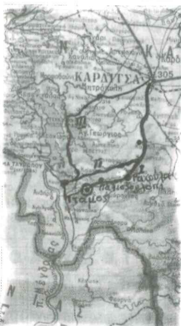
Η διαδρομή προς Ιταμο

Στον καιρό της κατοχής, τα βουνά του Ιτάμου ήταν το κέντρο της αντίστασης και του ένοπλου αγώνα κατά των κατακτητών. Εδώ τον Ιούλιο του 1944 έγινε το Β' Πανθεσσαλικό Συνέδριο της Αντίστασης. Ο χώρος πάνω από τη βρύση είχε διαμορφωθεί σε ένα τεράστιο αμφιθέατρο. Στο συνέδριο έλαβαν μέρος περισσότεροι από χίλιοι αντιπρόσωποι των αγωνι-