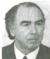
Γράφει ο Λάμπρος Γριβέλλας

Απόπασχα και ο πειρασμός για το συγγραφέα αυτού του σημειώματος είναι μεγάλος. Φταίνε και τα οικονομικά της εφημερίδας, που δεν τον επέτρεψαν να σας τα... ψάλλει επίκαιρα. Συγχωρήστε του λοιπόν την επιμονή ν' ασχοληθεί ετερο-