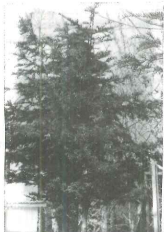
Το φυτό ιταμος

σης, αράδιαζαν στη σειρά τα "κατσιούπια" με το βούτυρο να παγώνει, και να το μεταφέρουν την επομένη στην αγορά της Καρδίτσας. Κι όταν οι βλαχοπούλες έστηναν κοντά στη βρύση τα καζάνια για να πλύνουν τα σκουτιά, πάντα στο κεφαλόβρυσσο καθόταν ένας βλάχος με το τουφέκι στα γόνατα. Άλλοι καιροί, άλλα ήθη!