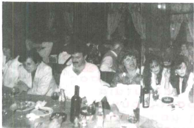
Ένα όμορφο σύνολο Κοινοτικών Γραμματέων από τη δεξίωση

που είχαν μέχρι σήμερα, την Παρασκευή 14 Μαΐου, στο κοσμικό κέντρο SALE, διοργάνωσαν επίσημη δεξίωση προς τιμήν τους.