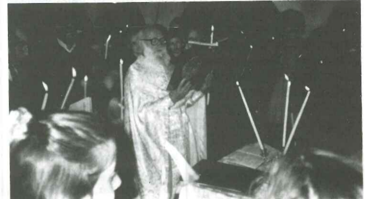
Από το φετινό Πάσχα στον Αμαραντιο

Η μεγαλύτερη γιορτή της ορθοδοξίας γιορτάζεται με μεγαλοπρέπεια σε όλα τα χωριά των Αγράφων. Το Σάββατο του Λαζάρου τα κοριτσάκια του χωριού με καλάθια στολισμένα με ανεμώνες και άλλα αγριολούλουδα αναγγέλουν στις αγραφιώτικες αυλές την Ανάσταση του Λαζάρου και τον ερχομό του