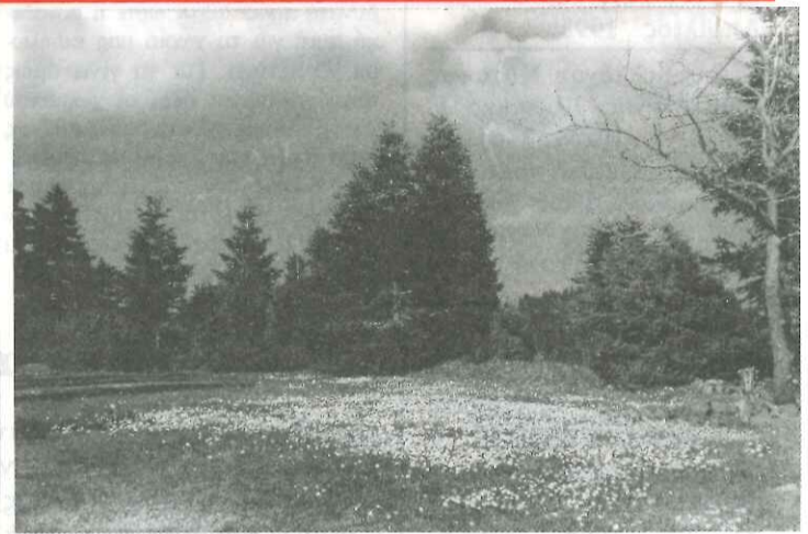
Η "Κούλια" Ιτάμου