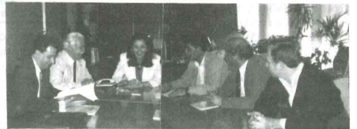
Από τη συνάντηση αντιπροσωπείας της Ε.Α.Χ. με την κ. Ντόρα Μπακογιάννη

τον Υπουργό Υγείας κ. Δ. Σιούφα για οικονομ. ενίσχυση της Ε.Α.Χ. Στη συνάντηση με την κ. Ντόρα Μπακογιάννη συμμετείχαν και οι βουλευτές Σπ. Ταλιαδούρος και Α. Σκυλάκος (Δάρισα)-ο δεύτερος μετά από επαφή της Ένωσης με τον πρόεδρο του Κ.Κ.Ε. Χαρίλαο Φλωράκη ρύθμισε τη συνάντηση και υποστήριξαν θερμά τα αιτήματα της περιοχής.