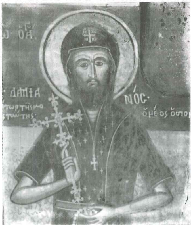
Ο Αγραφιώτης "Άγιος Δαμιανός"

(Β' ΜΕΡΟΣ - ΣΥΝΕΧΕΙΑ ΑΠ' ΤΟ ΠΡΟΗΓΟΥΜΕΝΟ ΦΥΛΛΟ ΥΠ' ΑΡΙΘΜ. 40)