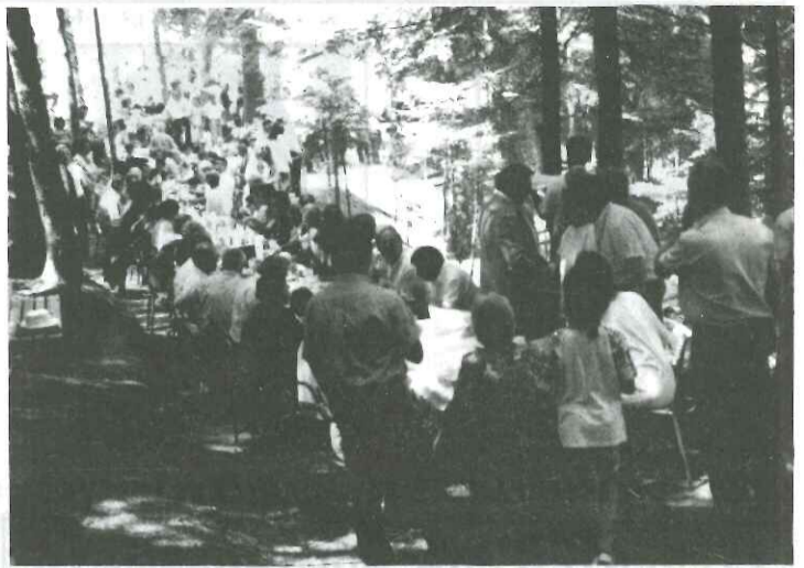
Αγραφιώτικη φιλοξενία στον Ίταμο

Οι υπόλοιποι, αφού φροντίσουν να βρουν κάποιο γιατάκι κάτω από τα έλατα, για να εγκαταστήσουν την οικογένεια για το