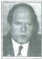
Γερ. Αρσένης Υπ. Εθν. Άμυνας