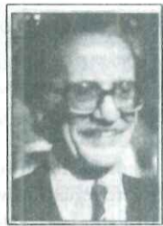
Αν. Πεπονής Υπ. Προεδρίας