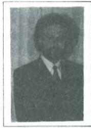
Βασ. Τσιλίκας Γ.Γ. Υπ. Προεδρίας

Μια πλειάδα κυβερνητικών στελεχών έχουν προσωπικούς δεσμούς με τ' Αγραφα και την Ένωση Αγραφιωτικών Χωριών.