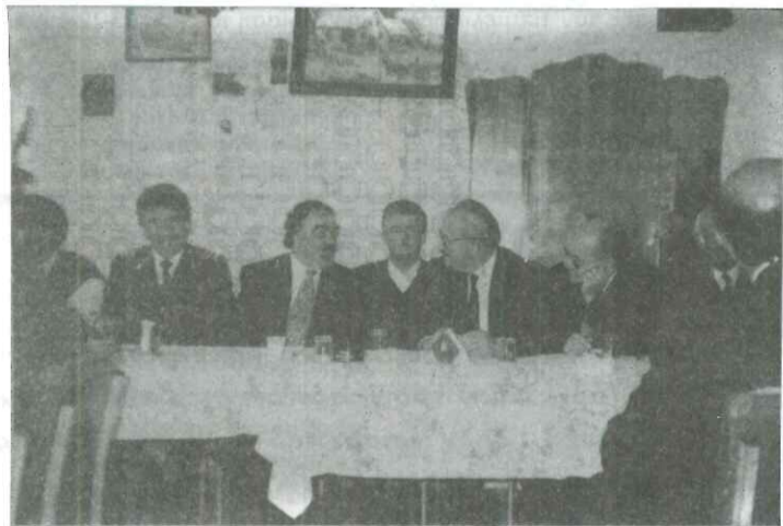
Μετά την εκδήλωση, παράθεση χεύματος στους επισήμους

Σαραντά χρόνια αφ' ότου ο Νικόλαος Πλαστήρας, ο άξιος του Έθνους έκλεισε τα μάτια και άφησε το Έθνος φτωχότερο. Περισσότερο φτωχό απ' όσο φτωχός πέθανε Εκείνος, γιατί όλα τα' δωσε για την πατρίδα. Όμως, «τη Ρωμοσύνη μην την κλάις», όταν γεννά άνδρες σαν τον Πλαστήρα. Ζωντανοί ή Πεθαμένοι στέκουν μπροστάρθηκες και το εμψυχώνουν και το καθοδηγούν.