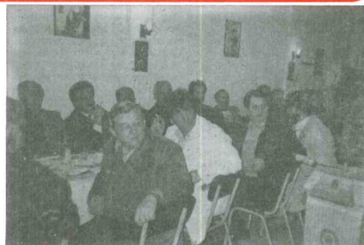
Οι εκπρόσωποι Κοινοτήτων παρακολουθούν την ομιλία του Νομάρχη

Ευρεία σύσκεψη Αγραφιωτών με συμμετοχή του νέου Νομάρχη κ. Στ. Κατσανίδη και υπηρεσιακών παραγόντων, πραγματοποιήθηκε στην κοινότητα Μοσχάτου, την 1η Δεκεμβρίου στις 6.30 μ.μ. Στη σύσκεψη έλαβαν μέρος 50 περίπου κοινοτάρχες, γραμματείς κοινοτήτων, πρόεδροι συλλόγων, ειδικοί επιστήμονες και υπηρεσιακοί παράγοντες. Ήταν καταρχήν μια σύσκεψη γνωριμίας του κ. Νομάρχη με τους φορείς των Αγραφιωτικών χωριών και μια πρώτη γεύση γι' αυτόν των σοβαρών προβλημάτων που αντιμετωπίζουν τα χωριά μας.