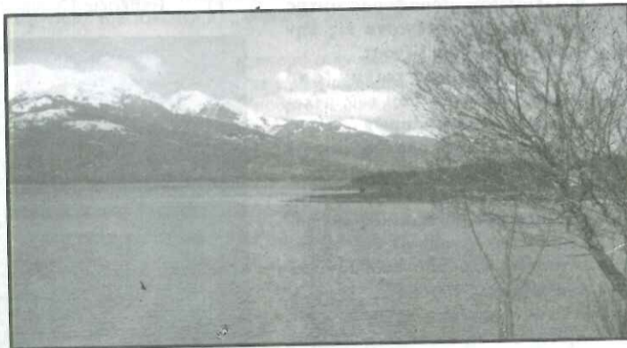
Η λίμνη του Ν. Πλαστήρα

Σε παλιότερες εποχές το χιόνι ήταν ευχή Θεού και ο καλός ο νοικοκύρης το χειμώνα χαίρονταν όπως λέει και η παροιμία. Τότε όμως τα αμπάρια ήταν γεμάτα με αλεύρι, τραχανά, όσπρια κ.λ.π. και στην τέμψη κρέμονταν άφθονα λουκάνικα, στα δοχεία λάα και στο βαρέλι μεσενικολίκιο ή μπλαζινό κρασί. Οι αγραφιώτες έτρωγαν, έπιναν και καμάρωναν το χιόνι. Δεν είχαν ανάγκη το ρεύμα της ΔΕΗ, τους έφραγε η λάμπα ή το καντήλι, ούτε τους ένοιαζε το λεωφορείο ή το ταξί της πόλης. Κι αν είχε κανένας αποκλειστεί στο δάσος στο μαντρί του μαζεύονταν παρέα 5-10 άντρες με λάμπες και με μπουκάλια κονιάκ και σε λίγο έφταναν στον αποκλεισμένο κτηνοτρόφο.