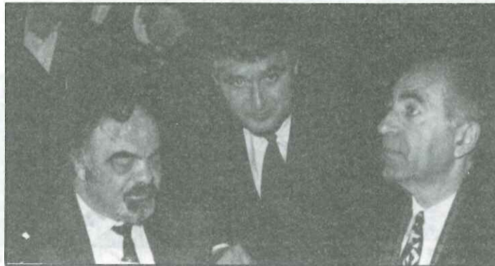
Ο διάσημος συμπατριώτης μας Κρις Σπύρου με το Νομάρχη Καρδίτσας και τον Πρόεδρο της Ε.Α.Χ.