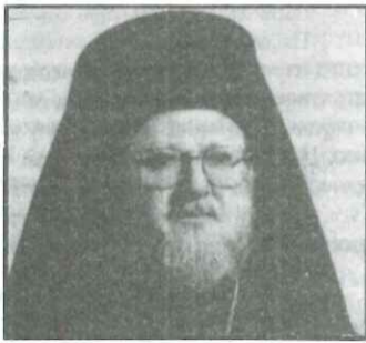
Ο Πατριάρχης ΒΑΡΘΟΛΟΜΑΙΟΣ

Ο Οικουμενικός Πατριάρχης Κωνσταντινουπόλεως ΒΑΡΘΟΛΟΜΑΙΟΣ, ανταποκρίθηκε σε αίτημα της Ένωσης Αγραφιωτικών Χωριών και έστειλε μήνυμα, το οποίο θα συμπεριληφθεί στην επανέκδοση του λευκώματος "ΑΓΡΑΦΑ".