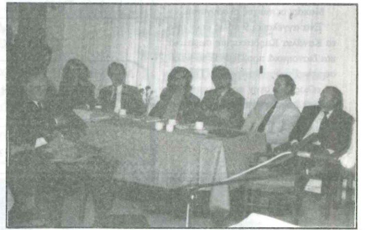
Η ομάδα μελετητών μηχανικών