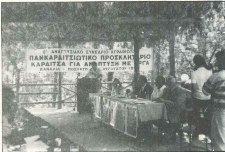
Από τις εργασίες του Συνεδρίου

σαν τα αποτελέσματα αρχ. ερευνών στην περιοχή μας.