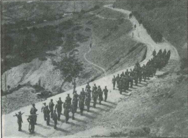
Από την ηρωική εποχή της Αντίστασης στα Άγραφα

δραν Αξιωματικών του Ε.Λ.Α.Σ. Την πρωτοβουλία της εκδήλωσης αυτής είχε η Κεντρική Π.Ε.Α.Ε.Α. Αθηνών σε συνεργασία με το Μουσείο Εθνικής Αντίστασης Ρεντίνας - Αγράφων.