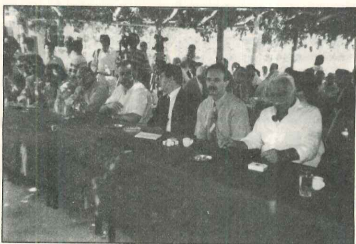
Οι επίσημοι του Συνεδρίου

Με μεγάλη επιτυχία και με συμμετοχή πολλών επισήμων αλλά και χιλιάδων λαού έγινε κι εφέτος το 6ο συνέδριό μας το Σάββατο το βράδυ 6 Αυγούστου στην πλατεία των Καναλιών και την Κυριακή πρωί 7 Αυγούστου στον Ξενώνα Μοσχάτου, στο