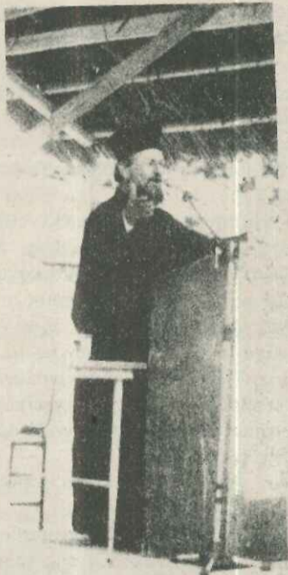
Έκπρόσωπος τής εκκλησίας άπευθύνει χαιρετισμό.

ξάκος, Αν. Φιλίππου, Αρ. Φιλίππου) οι όποιοί ζήτησαν τήν άπαλλοτριώση τών τσιφλικιών, τήν ίδρυση βιομηχανικής μονάδας ξύλου, τήν συνέχιση κατασκευής τών όρόμων Καρδίτσας - Αγρινίου, Μητρόπολης - Μορφοβουνίου, τήν άλυτευτική άξιοποίηση, παράλληλα με τήν τουριστική τής λίμνης Πλαστήρα