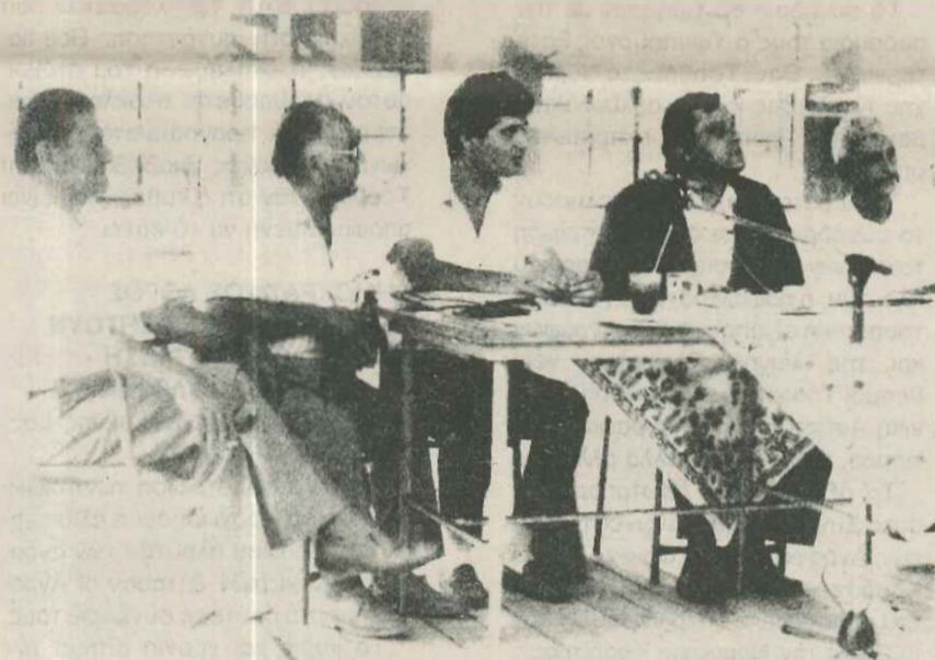
Ό ύφυπουργός Εσωτερικών κ. Τσούρας, άναπτύσσοντας θέματα Τοπικής Αυτόδιοίκησης.

Η παρουσία όλων σας σήμερα άποτελεί τή μεγαλύτερη δικαίωση αυτών που πίστεψαν στην άναγκη