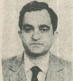
Ο βουλευτής Σ. Αναστασιάκος

Οι ενδιαφερόμενες κοινότητες τής περιοχής και άλλοι φορείς (π.χ. Ένωση Αγραφιώτικων Χωριών) σε συνενόηση με τόν Νομάρχη και τις άλλες αρμόδιες υπηρεσίες να ζητήσουν τόν αιτημά τους να υιοθετηθεί