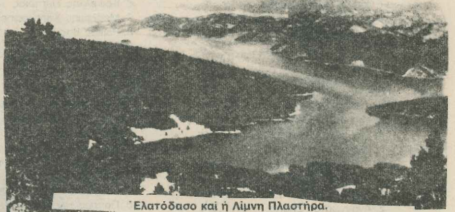
Ελατόδασο και η Λίμνη Πλαστήρα.

Έτσι η τουριστική ανάπτυξη της περιοχής της λίμνης Ν. Πλαστήρα (Μέγδοβα) κάτω από τις προτεινόμενες προϋποθέσεις ορθολογικής διευθέτησης της τοπικά ενεργοποιούμενης τουριστικής κατανάλωσης ανάγεται στην βασική οικονομική δραστηριότητα που μπορεί να εξασφαλίσει ικανοποιητικό βιοτικό επίπεδο και συνακόλουθα την ανάπτυξη της πληθυσμιακής συρρίκνωσης