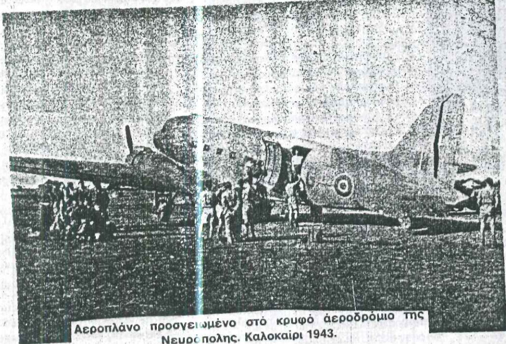
Αεροπλάνο προετοιμαζόμενο στο κρυφό αεροδρόμιο τής Νεβρόπολης. Καλοκαίρι 1943.