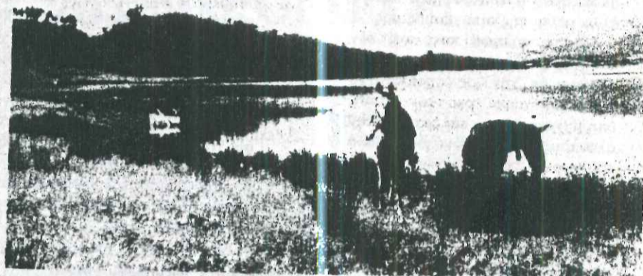
«Το νερό της λίμνης απαραίτητο για την άρδευση των Παραλιμνίων εκτάσεων».