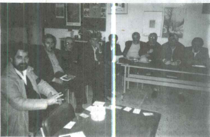
Οι πρόεδροι των Αγρ. Χωριών στα γραφεία της Ένωσης, συζητούν για τα προβλήματα της περιοχής

"Όνομα και πράγμα" φαίνεται πως θέλουν το χωριό τους οι Μορφοβουνιώτες. Ετσι με πρωτοβουλία της Κοινότητάς τους και με τη βοήθεια του