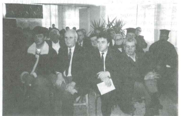
Πρωτοπόρο πρόγραμμα Παιδείας στη Βατσουνιά

Σοβαρότατο πρόβλημα έχει δημιουργηθεί στον Άγιο Γεώργιο, από κατολισθήσεις που έγιναν σε 4 σημεία του χωριού. Στο κέντρο του χωριού, η