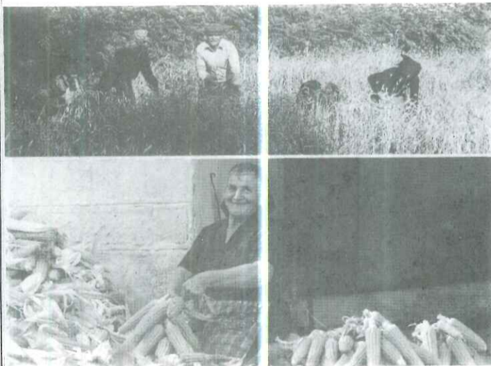
Προτεραιότητα στον Αγροτουρισμό από το πρόγραμμα Leader

Πίστωση ενός δις κατανέμεται στο νομό Καρδίτσας για τη χρηματοδότηση της "Κοινοτικής πρωτοβουλίας LEADER II". Το παραπάνω ποσό εγκρίθηκε από τη Γενική Γραμματεία της Περιφέρειας Θεσσαλίας. Είναι δωρεάν επιχορήγηση και με βάση αναπτυξιακή πρόταση της ΑΝ.ΚΑ. Α.Ε. θα "αγκαλιάσει" το σύνολο του ορεινού όγκου με επεμβάσεις τουριστικής, αγροτικής και επιχειρηματικής μορφής. Το κυρίως βάρος θα "πέσει" στη Λίμνη Ν. Πλαστήρα.