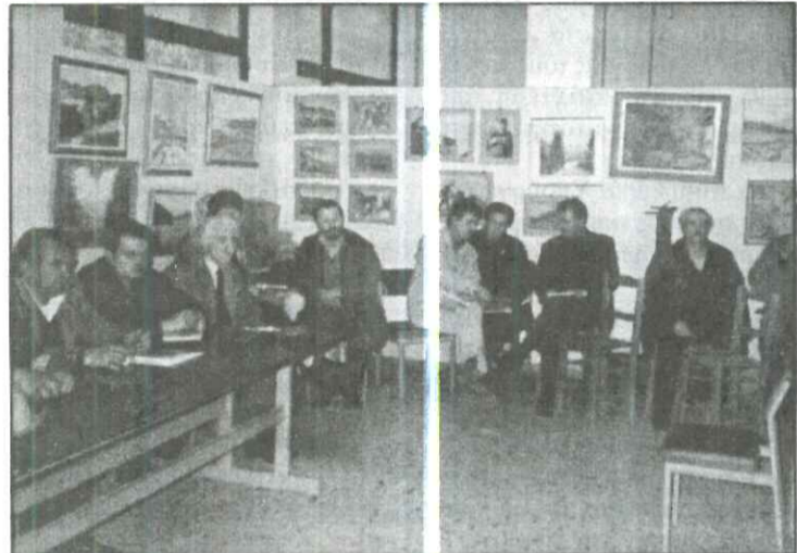
Ανεπαρκείς πιστώσεις για θέματα των Ο.Τ.Α. και σύνταξη μελετών

Δρακότρυπα 2 εκ., Δροσάτο 300 χιλ., Ελληνόαστρο 1 εκ., Καλλιθήρο 2.5 εκ., Καροπλέσι 4 εκ., Καρούα 1.5 εκ., Καταφύγι 3 εκ., Καταφύλλι 1 εκ., Κρουονέρι 1.5 εκ., Μάραθος 1 εκ., Μπελοκομύτης 1.5 εκ., Πετροχώρι 2 εκ., Πευκόβιτο 2.5 εκ., Πορτή 1.5 εκ., Π.Ιθώμις 1 εκ., Ραχούλα 1 εκ., Μπελοκομύτης 500 χιλ.