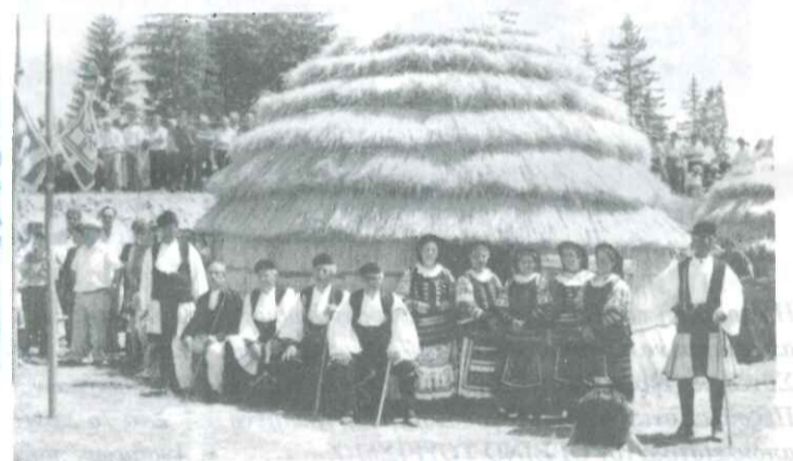
Σαρακατσάνικου λόγου". Σελ. 33-37.

3. Αρη Πουλιανού, Προέδρου Ανθρωπολογικής Εταιρείας Ελλάδος. Θέμα: "Οι Σαρακατσαναίοι, ένα πανάρχαιο ελληνικό φύλο". Σελ. 39-41.